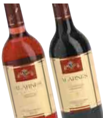
Vino joven tinto o rosado ALARNES D.O. Navarra 75 cl. (L. 1,33€)

Si llevas 3, la unid. te sale a: 1,99€ = 332 Ptas.