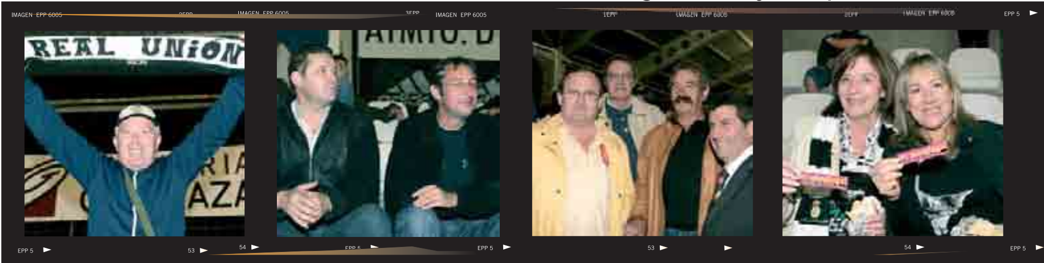
►Dando color y alegría ►Hay que estar atentos ►Directivos en “acción” ►”Directivas” que nunca faltan

► Aviso: Todo aquel que haya sido retratado por nuestros fotógrafos y no aparezca en este número, saldrá en el siguiente. ► Mándanos tus fotos a “ aloreil@orimandinga.com ” y las publicaremos.