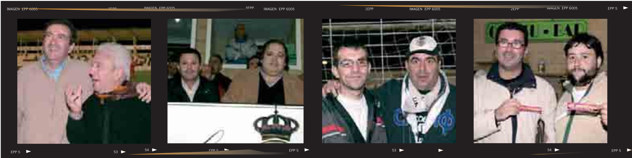
►Desde el cespèd con orgullo ►Alkate jauna eta presidentea ►Ni ere Txuribeltz!