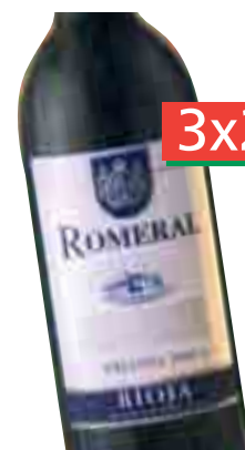
ROMERAL Crianza 2004 D.O. Ca Rioja (Unid. 3,69€) 75 cl. (L. 3,28€)

Si llevas 3, la unid. te sale a: 2,46€ = 409 Ptas.