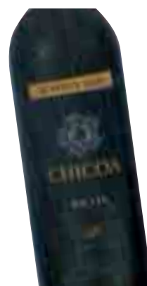
CHICOA reserva 2003 D.O. Ca Rioja 75 cl. (L. 4,00€)