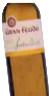
GRAN FEUDO Chardonnay 2006 D.O. Navarra 75 cl. (L. 6,12€)