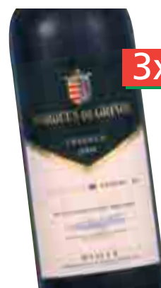
MARQUES DE GRIÑON Crianza 2004 D.O. Ca Rioja (Unid. 4,85€) 75 cl. (L. 4,30€)

Si llevas 3, la unid. te sale a: 2,33€ = 388 Ptas.