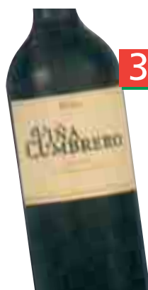
VIÑA CUMBRERO Crianza (Unid. 4,69€) 75 cl. (L. 4,17€)

Si llevas 3, la unid. te sale a: 2,46€ = 409 Ptas.