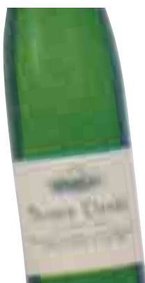
TXOMIN ETXANIZ 2006 D.O. Txakoli Guetaria 75 cl. (L. 10,06€)