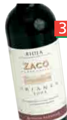
VIÑA ZACO Crianza 2003 D.O. Ca Rioja (Unid. 5,99€) 75 cl. (L. 4,84€)

Si llevas 3, la unid. te sale a: 3,63€ = 604 Ptas.