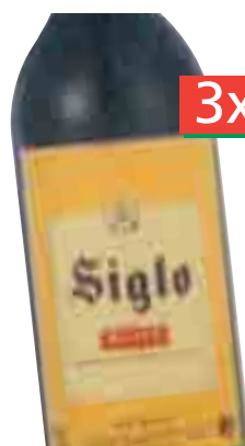
SIGLO C.V.C. D.O. Ca Rioja (Unid. 3,50€) 75 cl. (L. 3,10€)

Si llevas 3, la unid. te sale a: 3,13€ = 520 Ptas.