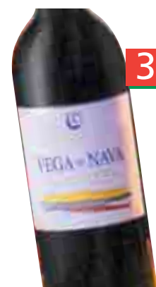
VEGA DE NAVA Crianza 2003 D.O. Ribera del Duero (Unid. 5,69€) 75 cl. (L. 5,05€)

Si llevas 3, la unid. te sale a: 3,23€ = 537 Ptas.