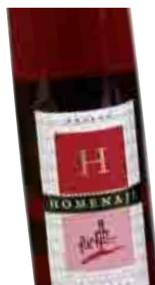
HOMEJANE 2006 D.O. Navarra 75 cl. (L. 3,98€)