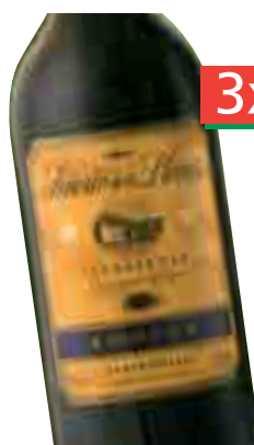
SEÑORIO DE LOS LLANOS Reserva 2001 D.O. Valdepeñas (Unid. 2,99€) 75 cl. (L. 2,65€)

Si llevas 3, la unid. te sale a: 3,79€ = 631 Ptas.