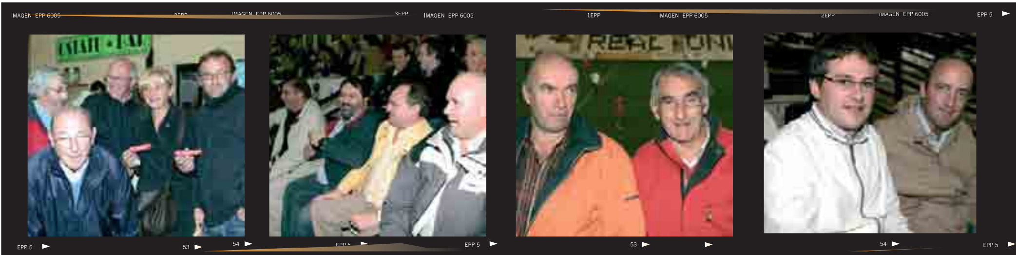
►Ambiente en el descanso ►El palco a “tutiplen” ►El partido detras