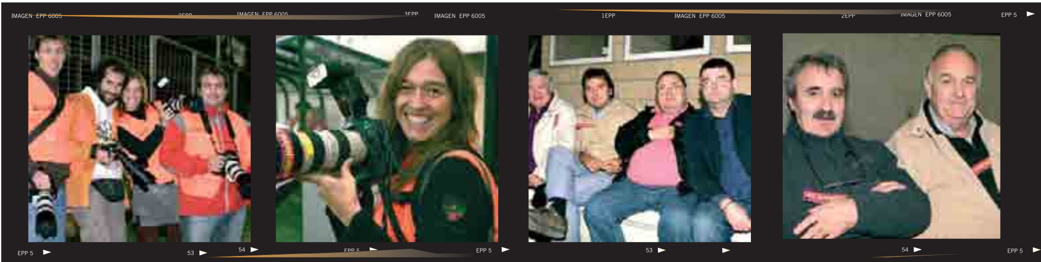
►Al otro lado de la cámara ►Kazador, kazado ►Este es un deporte serio